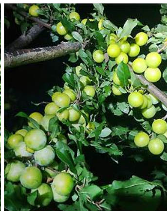
В процессе созревания