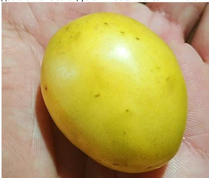
Алыча гибридная Лимончик

Созревание в середине августа. Повреждение плодовой жоркой замечено не было. Устойчивость к заморозкам достаточно высокая, устойчивость к болезням низкая. Проверенная зимостойкость до -40 С.