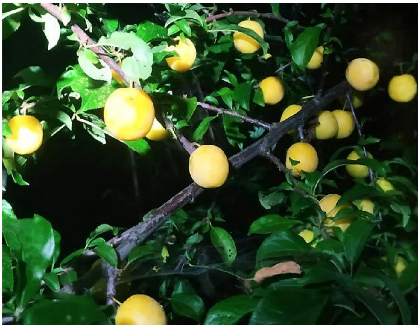
В начале созревания

Первые плоды в сезоне 24 года созрели в начале августа. Период плодоношения растянутый, созревание неравномерное до начала сентября. По первым результатам устойчивость в вредителям и заморозкам высокая. Урожайность выше среднего, для первого урожая хорошая.