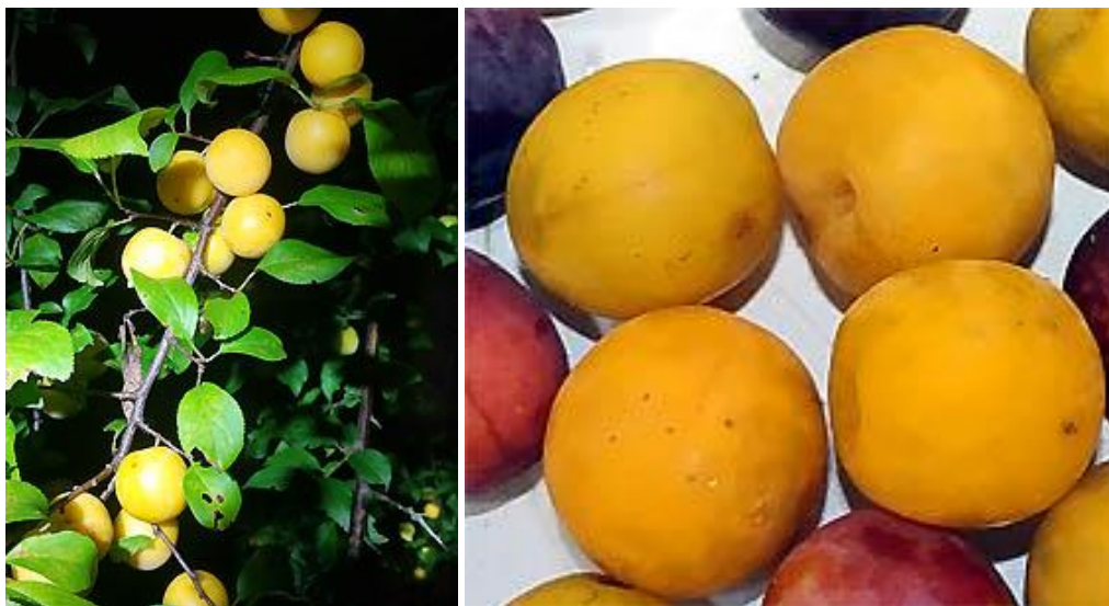
Алыча 2024-11 (Ароматная-2) Алыча 2024-12

11. В целом похожа на образец 2024-9. Отличается более светлой, золотистой окраской плодов, вес около 20 гр. Присутствует напоминающий абрикос аромат. Созревание в середине августа. Устойчивость к болезням и заморозкам достаточно высокая.