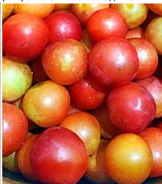
Алыча гибридная 2024-15