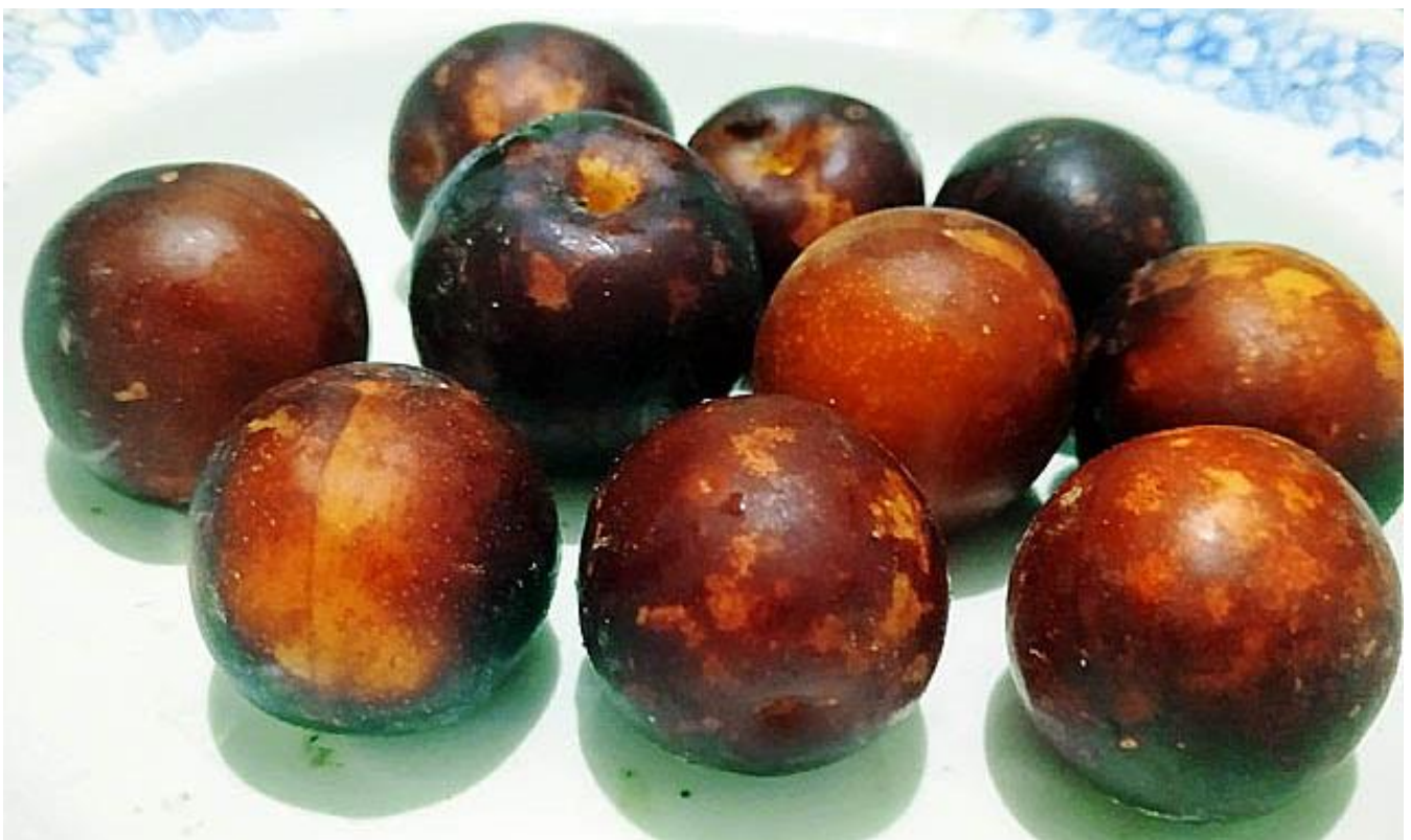
22. Алыча гибридная Сливовая Сладкая – оригинальный сорт алычи с плодами имитирующими по внешнему виду и вкусовым качествам синие сорта сливы домашней. Учитывая большую морозостойкость и отменную